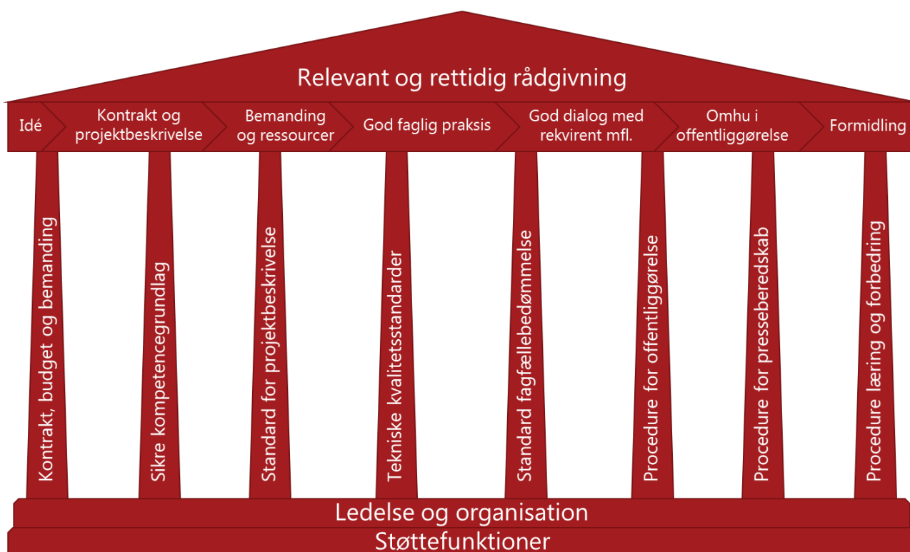
Figur 2 Illustration af delene i kvalitetssikringen og kvalitetsstyringen af en ydelse, jf. afsnit 3.3.

prislister. Til denne type opgaver er der ofte knyttet særlige tekniske kvalitetsstandarder. Som udgangspunkt er disse ydelser ikke omfattet af kvalitetshåndbogens faste procedurer, men derimod de tekniske kvalitetsstandarder.